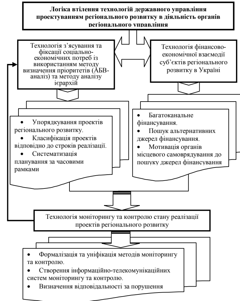
Рис. 2. Комплексний алгоритм запровадження технологій державного управління проектуванням регіонального розвитку

Комплексний алгоритм запровадження технологій менеджменту, які трансформовано в технології державного управління проектуванням регіонального розвитку, розкрито крізь призму логіки їхнього втілення в діяльність органів регіонального управління (рис. 2).