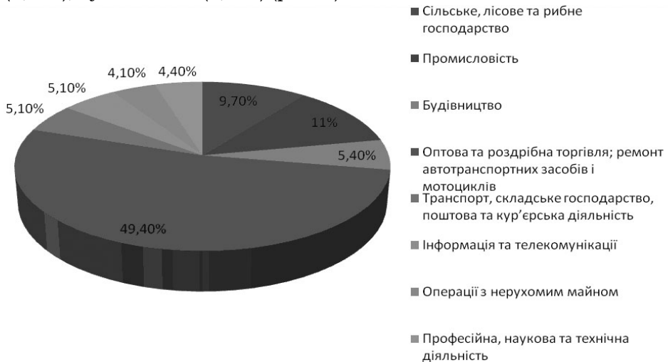
Рис. 2. Питома вага обсягу реалізованої продукції (товарів, послуг) суб'єктами малого підприємництва у 2015 р.

Аналіз показників обсягу реалізованої продукції (товарів, послуг) суб'єктами малого підприємництва у 2015 р. за видами економічної діяльності показав, що пріоритетними сферами для суб'єктів малого підприємництва залишаються оптова та роздрібна торгівля і сфера послуг, питома вага яких в загальному обсязі реалізованої продукції (товарів, послуг) складає 49,4 %. Значно меншими є показники промисловості (11,0 %), сільського господарства (9,7 %), будівництва (5,4 %) (рис. 2).