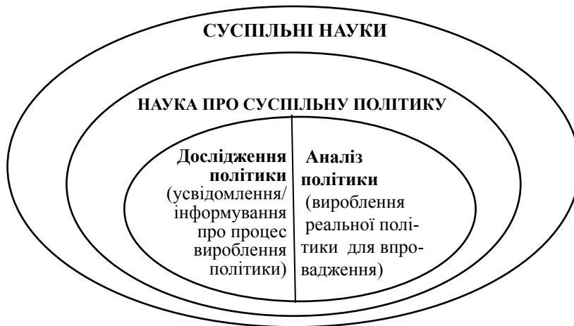
Рис. 2. Дисциплінарні рамки науки про суспільну політику

Схематично дисциплінарні рамки науки про суспільну політику (policy science) наведено на рис. 2.